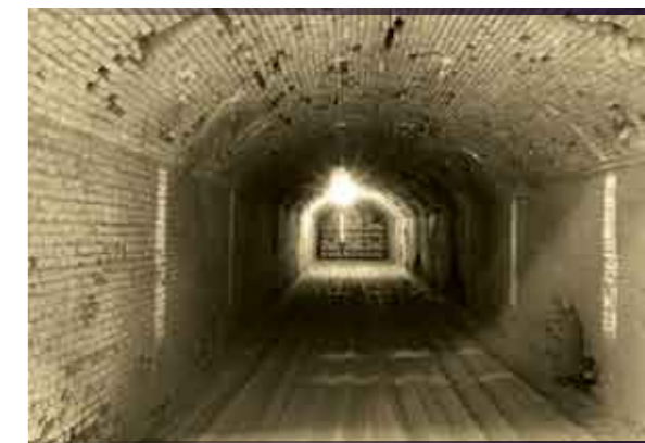
G Vista interior del antiguo horno.

"Cerámica Fanelli nace como una pequeña empresa familiar con ganas de crecer. Se industrializa e incorpora tecnología de última generación, pero siempre mantiene vivo el espíritu de trabajo y familia" sostienen sus directivos.